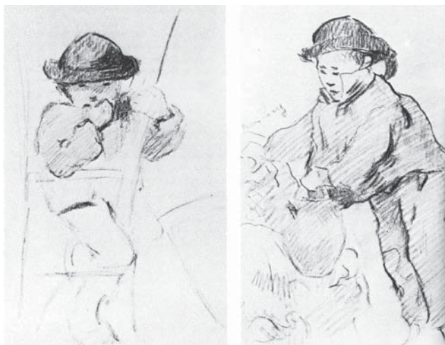
Paul Gauguin: Malý bretonský chlapec