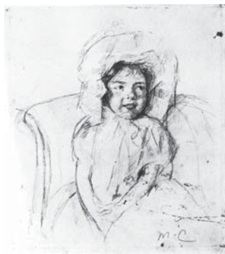
Mary Cassattová: Smějící se Margot v nabíraném čepci