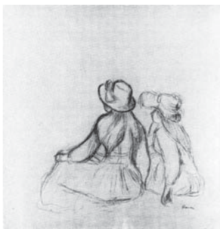
Pierre-Auguste Renoir: Dívčí věk

Psychosomatický neboli biopsychosociální model má alespoň zčásti tyto problémy zpracovány. Práce s nemocnými je pochopitelně náročnější a „selská psychologie“ zde nestačí. Proto je také nezbytné příslušné vzdělání. Ku zlosti farmaceutických firem si pak takový lékař často poradí i bez jejich zázračného léku.