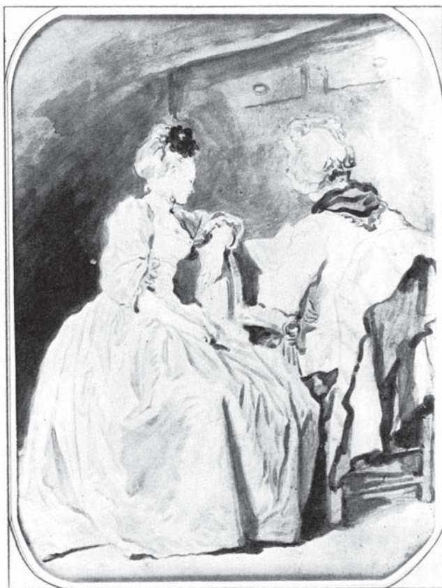
Jean-Honoré Fragonard: Četba