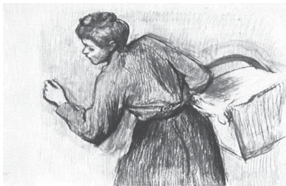
Edgar Degas: Pradlena nesoucí prádlo