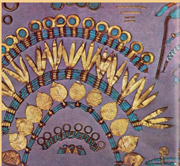
Ozdoba hlavy královny z Uru, 2500 př. n. l.

Abstrakta SVK Biomonitoring Mimozemšťani Ministerské plány Nežádoucí tvorové Profesura Syndrom vyhoření Šumava 2013 Úrazy dětí Vzdělání