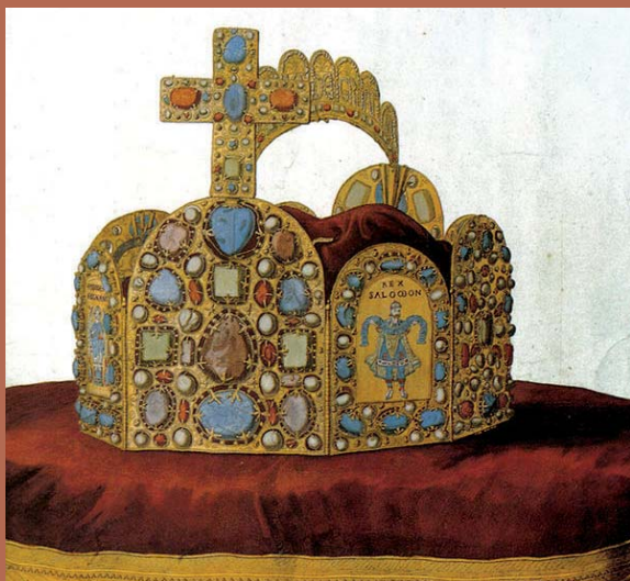
Koruna Svaté říše římské (1751)

Absolventi Abstrakta Demokracie Emoce Etický kodex In memoriam Jmenování Papež Romové Stýblová