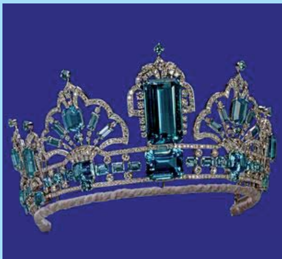
Tiara anglické královny